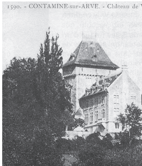
Château de Villy près Contamine

dessin d'après nature par Du Bois-Melly - 1890 - BPU